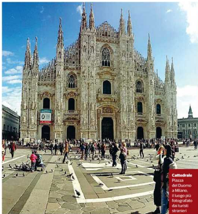
Cattedrale Piazza del Duomo a Milano, il luogo più fotografato dai turisti stranieri