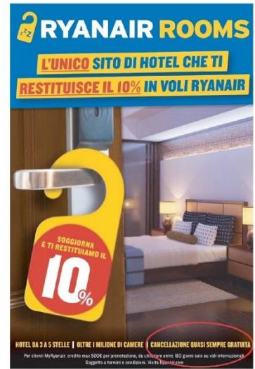
La campagna di Ryanair Rooms